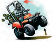
Volcamiento de vehículos