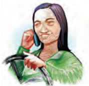
Manejando de modo descuidado