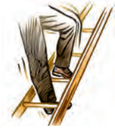
Riesgos de caídas