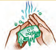
Buenas prácticas higiénicas de las manos