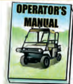
Entrenamiento de seguridad