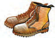
Zapatos con protección de metal