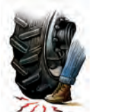
Daños físicos producidos por el tractor