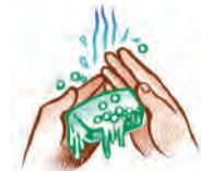
Buenas prácticas higiénicas de las manos