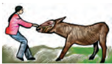
Evitar halar los animales