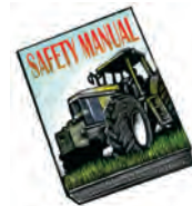
Entrenamientos de seguridad