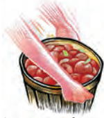
Levantamiento de objetos pesados