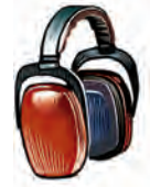
Protección del sentido auditivo