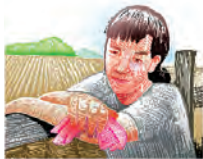
Estrés causado por el calor