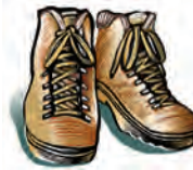
No use zapatos que resbalen