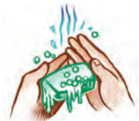
Buenas prácticas higiénicas de las manos