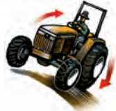
Volcamiento del tractor