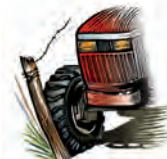
Atropellamiento por tractores