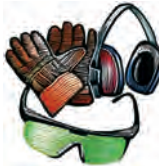
Equipo de protección personal