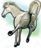
Patadas de animales