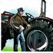
Inspección de seguridad