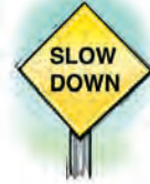
Reduzca la velocidad