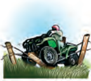
Colisión con obstáculos