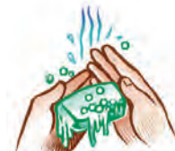
Buenas prácticas higiénicas de las manos