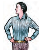
No ropa suelta o pelo suelto